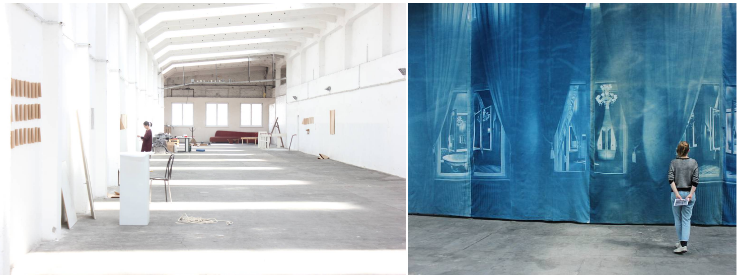
© Jule Tautz; rechts: "Pentimenti" (Löwenpalais) von Ute Lindner

Vom 6. Mai bis 14. Mai 2016 findet das analogueNOW! Festival für analoge Fotografie in Berlin Lichtenberg statt. Das Thema dieses Jahr lautet "Manipulation" und zeigt in einer zentralen Gruppenausstellung sowohl zeitgenössische, internationale Positionen zu gegenwärtigen Verfahren der analogen Fotografie als auch eine Auswahl an innovativen Fotobüchern. Neben der Ausstellung gibt es Workshops, Führungen, Vorträge und Podiumsdiskussionen sowie ein vielseitiges Rahmenprogramm mit Filmabend und Musik.